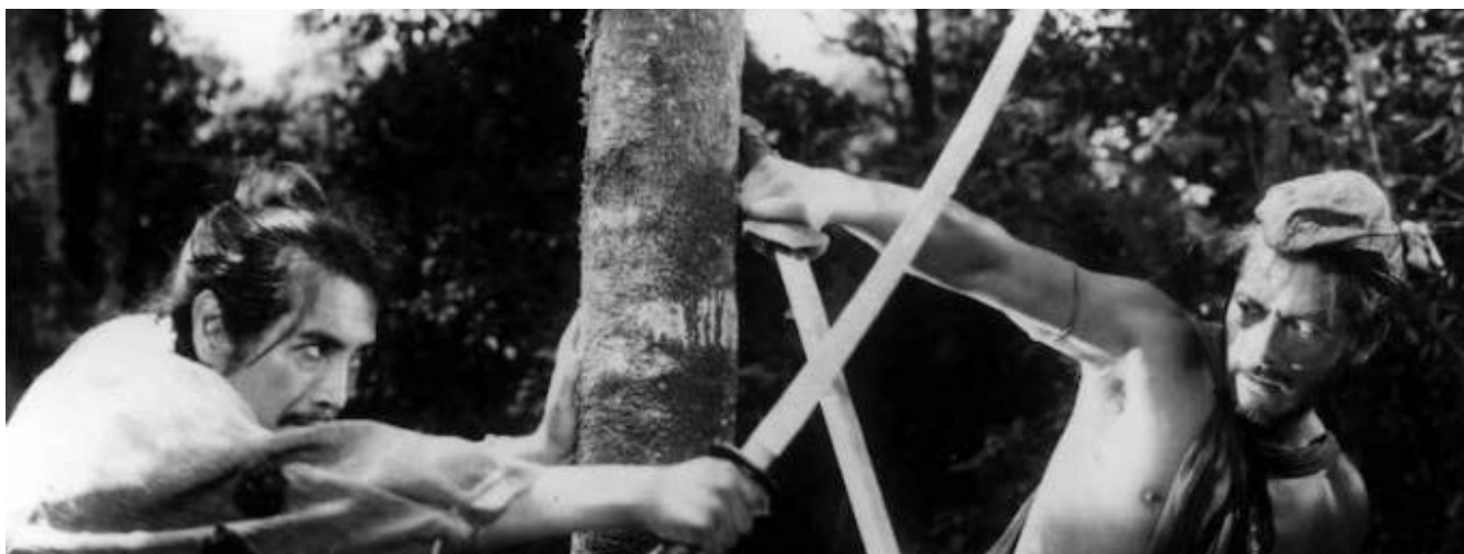
RASHOMON M FILM DVD.KUR.9

Tratto da due racconti di Ryunosuke Akutagawa, il film di Kurosawa vinse il premio come miglior film alla Mostra del cinema nel 1951. Un boscaiolo, un monaco e un passante si fermano a parlare dell'uccisione di un samurai, avvenuta per mano di un brigante. Una storia raccontata per flashback durante una giornata di pioggia incessante.