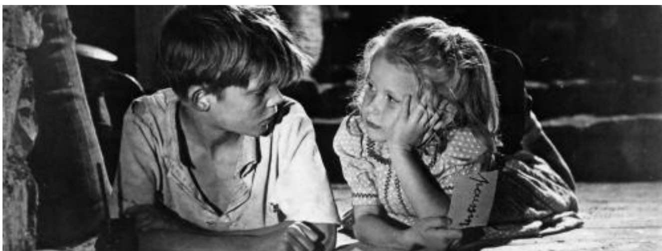
GIOCHI PROIBITI M FILM DVD.CLE.1

Tratto da due racconti di Ryunosuke Akutagawa, il film di Kurosawa vinse il premio come miglior film alla Mostra del cinema nel 1951. Un boscaiolo, un monaco e un passante si fermano a parlare dell'uccisione di un samurai, avvenuta per mano di un brigante. Una storia raccontata per flashback durante una giornata di pioggia incessante.