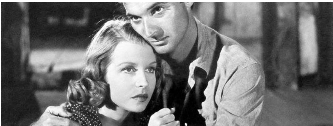
L'UOMO DEL SUD M FILM DVD.REN.5

Vincitore come miglior film alla Mostra del 1946, il film è tratto da 'Hold Autumn in Your Hand' di George Session Perry e fu diretto da Jean Renoir. Narra le vicende di un contadino di nome Sam. L'uomo acquista un piccolo appezzamento incolto, perché desidera mettersi in proprio. Purtroppo dovrà vedersela con mille difficoltà: l'asperità del luogo, l'ostilità dei vicini e le calamità naturali. Ma Sam non si abbatte e con caparbia porta avanti il proprio lavoro nella sua fattoria.