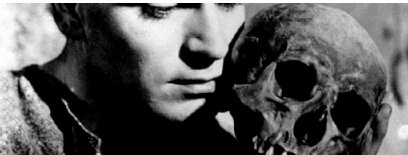
AMLETO M FILM DVD.OLIV.1

Vincitore come miglior film alla Mostra del 1946, il film è tratto da 'Hold Autumn in Your Hand' di George Session Perry e fu diretto da Jean Renoir. Narra le vicende di un contadino di nome Sam. L'uomo acquista un piccolo appezzamento incolto, perché desidera mettersi in proprio. Purtroppo dovrà vedersela con mille difficoltà: l'asperità del luogo, l'ostilità dei vicini e le calamità naturali. Ma Sam non si abbatte e con caparbia porta avanti il proprio lavoro nella sua fattoria.